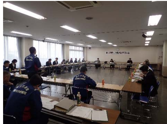
写真-3 第 10 回懇談会の様子

下館河川事務所からは平成 27 年 9 月に発生した出水からの復旧状況などが説明され、出水で洗掘された護岸や高水敷の復旧工事は、現在も施工中の箇所が残っている状況や、出水後の礫河原の生物のモニタリング調査では、指標種及び外来種の確認箇所が増加している状況が報告された。