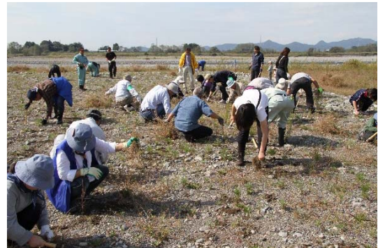
写真-2 シナダレスズメガヤの除去活動

本報告は、平成22年3月以降、平成29年2月の第10回まで、年1回程度のペースで開催されてきた懇談会を中心とした地域連携方策についてとりまとめたものである。