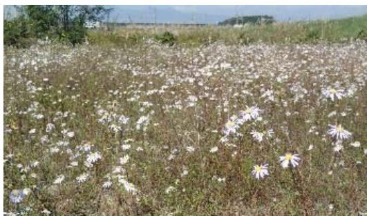
写真-1 シナダレスズメガヤ(上)とカワラノギク(下)

これらの取り組みをより広域的、かつ効果的・効率的に実施するため、地域連携方策として「鬼怒川の外