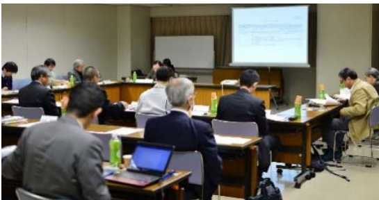
写真-4 美々川自然再生アクションプログラムワーキンググループ開催の様子

ただし、植生分布の明確な変化はまだ認められないことから、平成 28 年 12 月及び翌年 3 月に開催された美々川自然再生アクションプログラムワーキンググループにおいて継続調査の必要性が確認された。