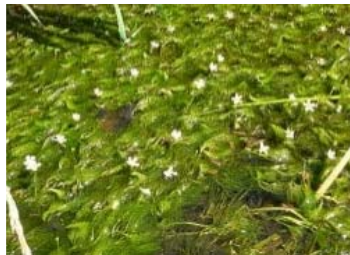
写真-3 再生したバイカモ

上記以外の区間ではクサヨシは拡大の傾向が認められず、バイカモやエゾミクリなど沈水植物群落再生が確認されている。