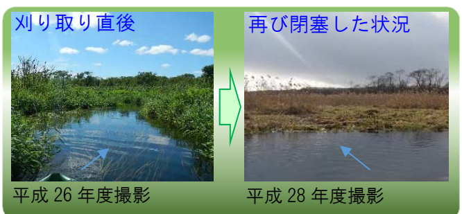
写真－2 クサヨシ浮島により再び閉塞した状況

平成 8 年頃には美々川の河川流量減少等が要因となり、クサヨシ群落が河道を覆い、沈水植物や魚類などの生育・生息環境にも影響を及ぼす状況になったことから、河道内で過剰に繁茂したクサヨシを平成 25 年と 26 年に除去した。