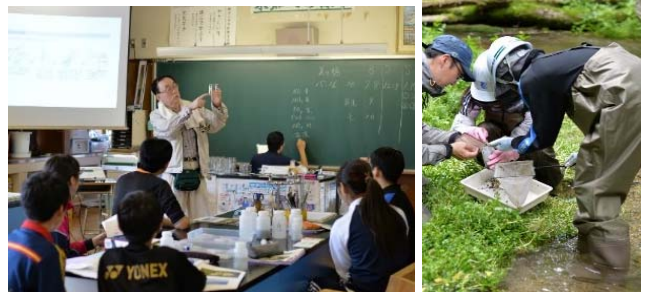
写真-6、7 環境学習の様子(教室・美々川)

複数ある湧水地点で水生昆虫の採取、採水を実施した。その後教室に移動して、水質検査(パックテスト)を実施し、湧水地点毎に水生昆虫の生息環境と水質の関係を考えた。