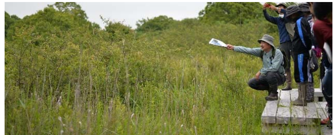
写真-5 環境学習の様子(ウトナイ湖)

湖岸からの距離や標高などをヒントに、どのように植生が変化しているかを木道から観察した。その際、過去の湖水位や植生分布をヒントに現在の植生に遷移する過程についても講義を受けた。また、観測孔の地下水の観測や、樹木の直径・樹高の計測を体験した。