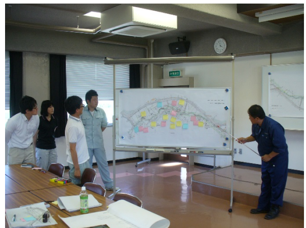
写真-3 現地踏査による環境特性の整理の指導状況