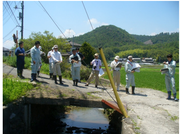
写真-2 現場での川の見方の指導状況