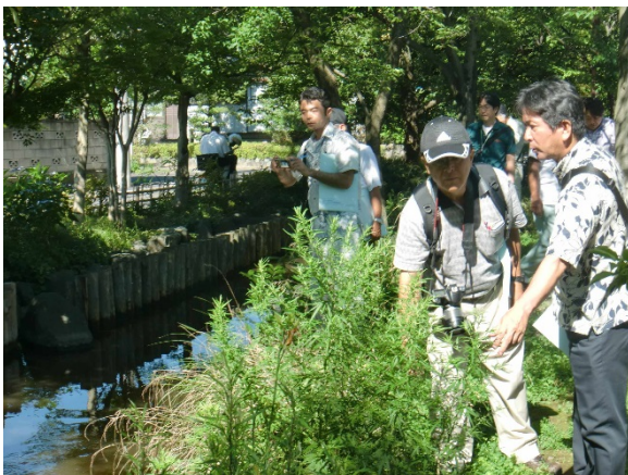
写真-1 多自然川づくりの事例の視察状況

相談内容も、中小河川に関する河道計画の技術基準について解説した『多自然川づくりポイントブックⅢ』(平成 23 年 10 月) の内容解説に関する講師派遣や現地へのアドバイザー派遣など、川づくりに関する技術的な内容から川づくりのプロセスに至るまで幅広い内容となっている。