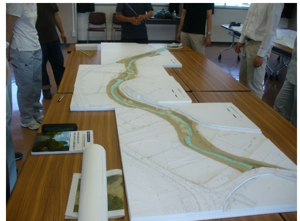
写真-4 模型を用いた川づくりの空間設計