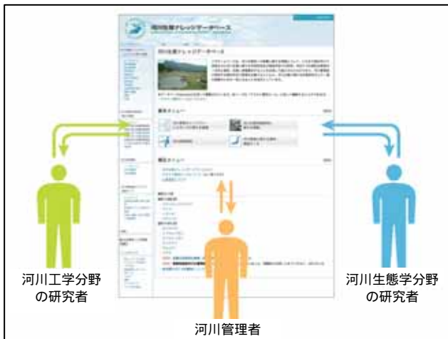
図 - 2 分散型共同編集データベースイメージ

また、ナレッジDBの設計に際しては、他システムやデータベースに係る情報を収集し、一体的な運用が図られるようセキュリティなど整合性の検討を行った。