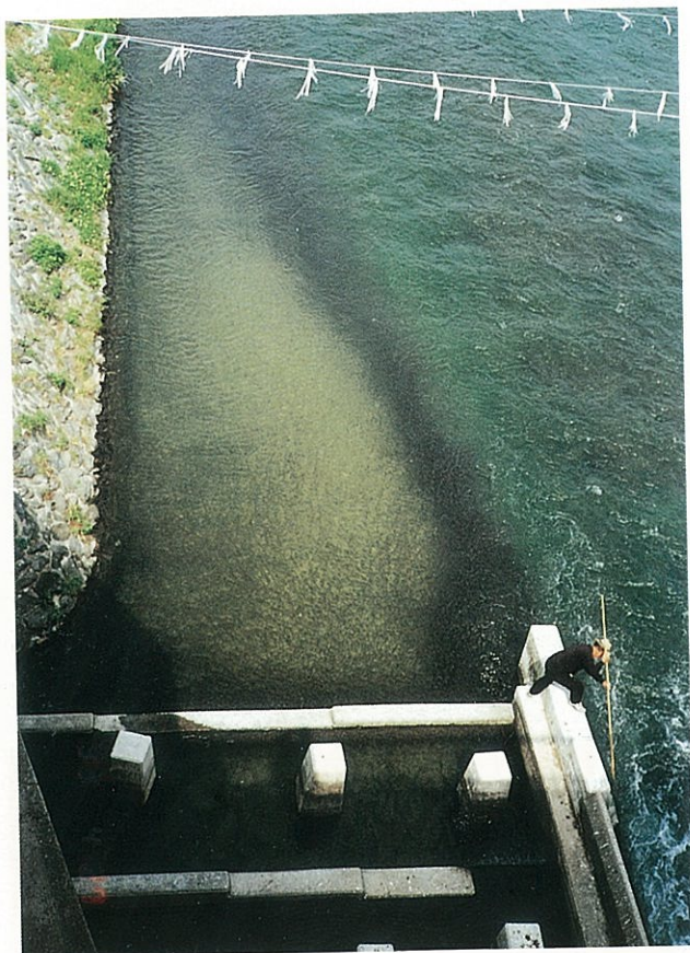
吉野川の鮎の稚魚の群（中央の黒筋）（徳島県・徳島市）