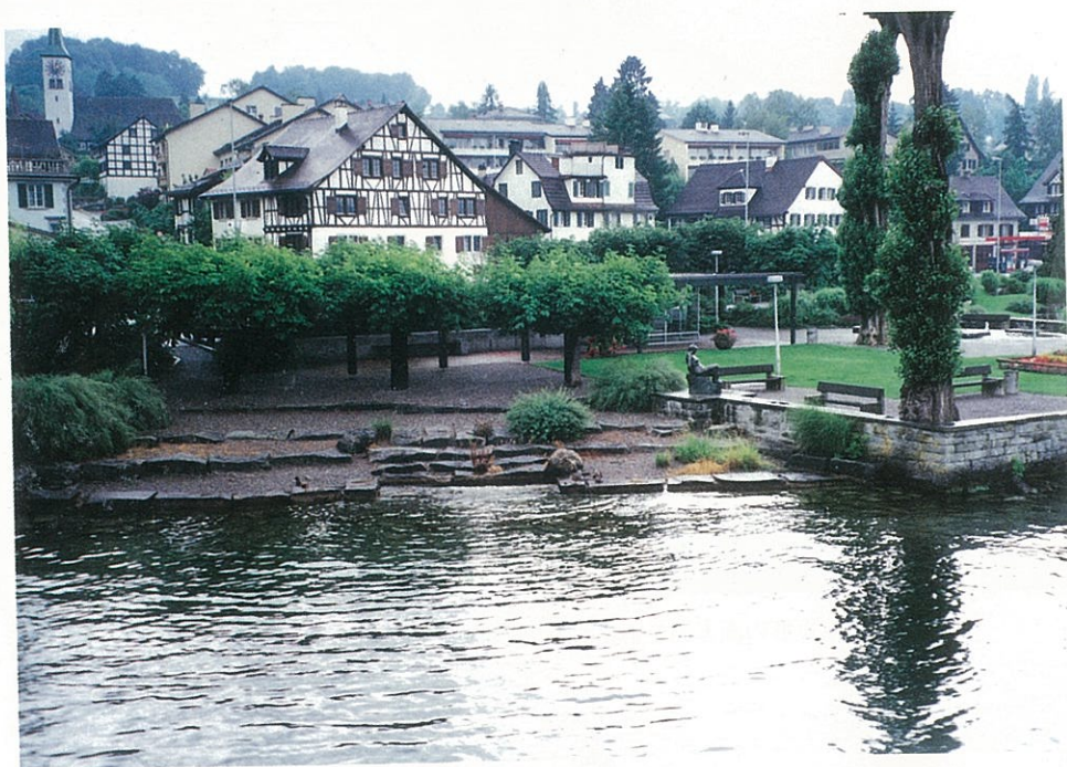
チューリッヒ湖畔の公園と親水施設（スイス・チューリッヒ州）