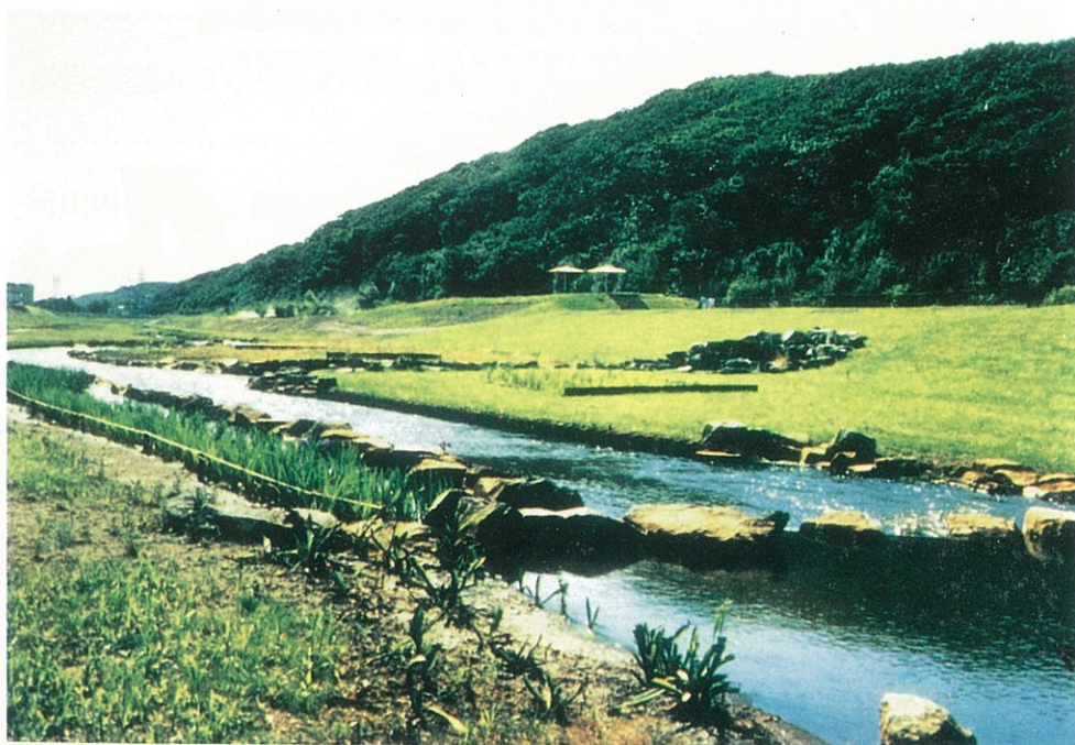
自然な形の瀬と淵を創出した 苫小牧川（北海道・苫小牧市）