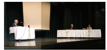
20周年記念鼎談の様子