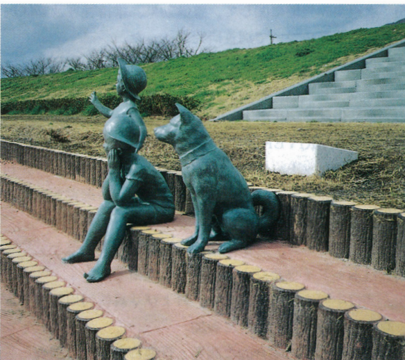
瀬戸川（焼津市）・「夕日を見る子供像」