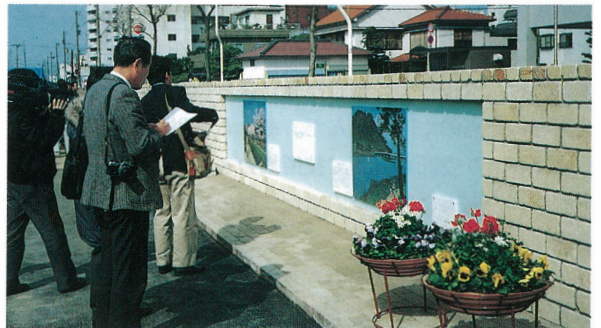
助任川（徳島市）・「セラミック壁画」