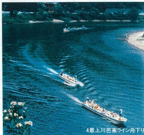
4 最上川芭蕉ライン舟下り