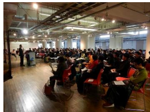
小さな自然再生サミット 2019 神戸大会

https://e-ve.event-form.jp/event/113571/collaboriversummit2025