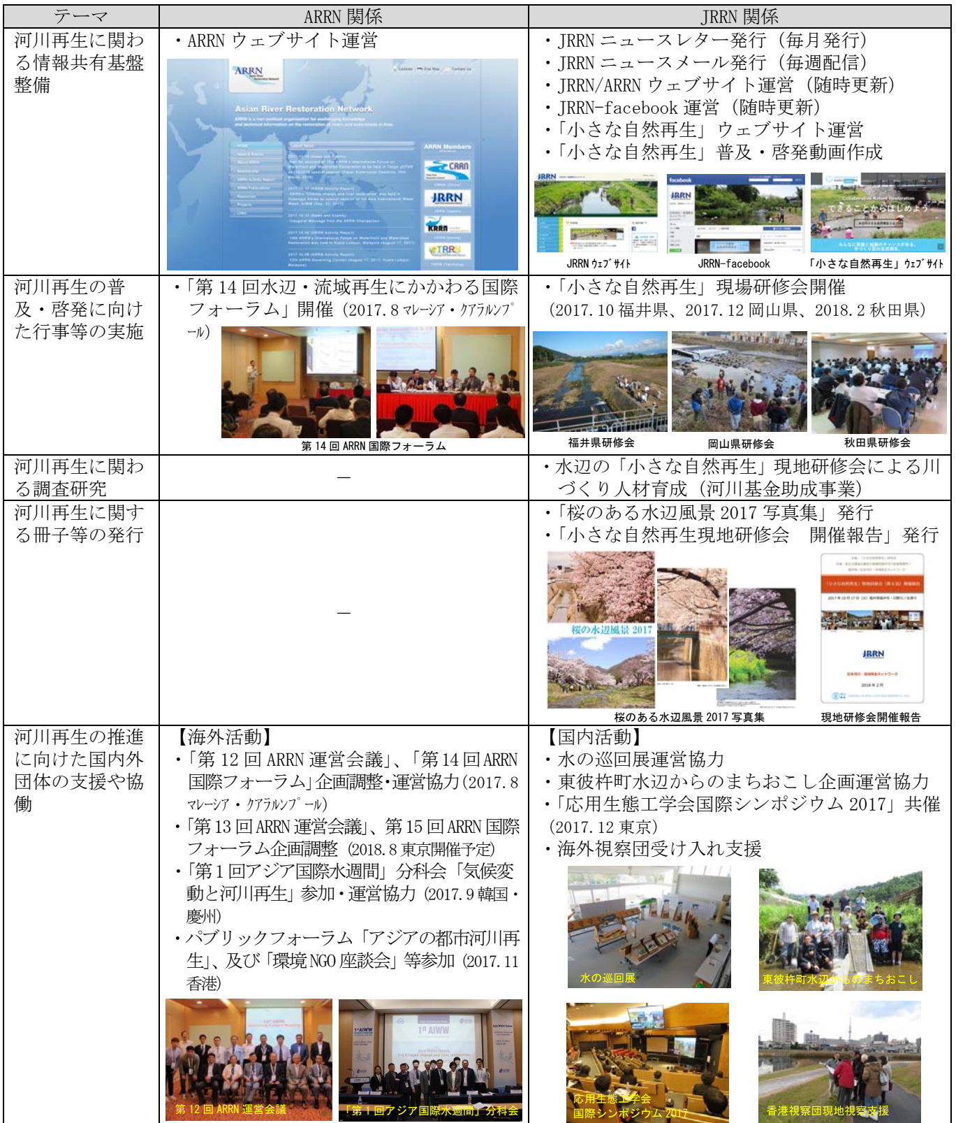
表-1 2017年度の主な活動概要

川づくり人材育成（「小さな自然再生」普及促進プロジェクト）”、“水辺・流域再生にかかわる国際フォーラム・ARRN 運営会議”が挙げられ、次章以降にそれらの活動について紹介する。