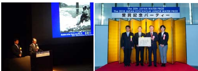
写真 9 日本水大賞表彰式及び受賞団体発表会の様子

2018 年 6 月 26 日（火）、第 20 回日本水大賞表彰式及び受賞団体発表会が日本科学未来館（東京都江東区）で開催され、JRRN が国内外の川づくりの担い手の方々と共に取り組んできた河川再生に関わる国内外の情報共有と人材交流活動「日本及びアジアの河川再生の担い手をつなぐ協働基盤構築」が、日本水大賞の「国際貢献賞」に表彰された。