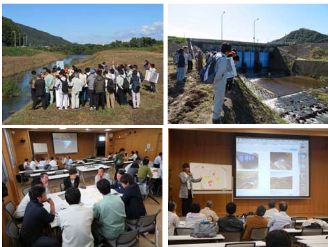
写真－3 秋田県現地研修会の様子