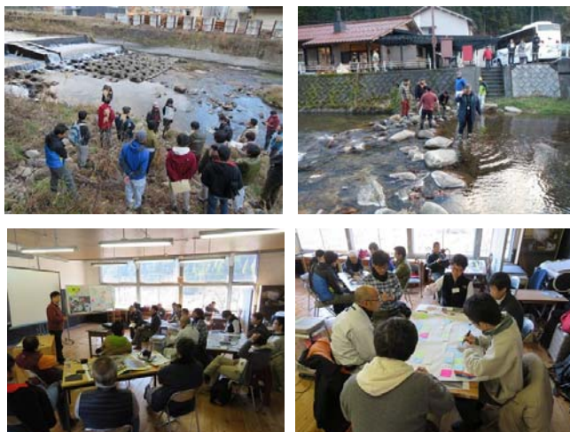
写真－4 岡山県西栗倉村現地研修会の様子

「吉井川のつながりを取り戻すには小さな自然再生で何ができるか」をテーマとしたワークショップでは、西栗倉村の資源を活用して人と川とのつながりを取り戻す手法や、そのための拠点となる場所について、「小さな自然再生」のアイデアを交えて討議を行った。