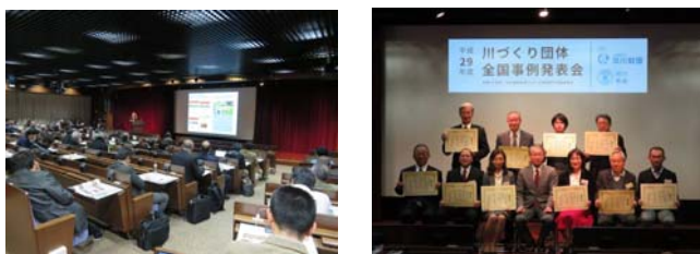
写真 8 河川基金優秀成果表彰式の様子

同発表会では、午前中に事例発表、午後からポスター発表と表彰式が行われた。事例発表では、これまで実施した現地研修会を中心に報告し、「小さな自然再生」という水辺・人・地域を繋ぐ協働のスタイルが各地で取り組まれていること、当活動の地道な成果が少しずつ各地の取組みの後押しにつながっていることを情報発信した。午後のポスター発表では、「小さな自然再生」に興味を持った方々、同様の取組みを実践している方々との意見交換がなされ、活動の継続に関する各団体共通の課題や、より良い投資効果を得るための工夫など、今後の活動の参考となる情報が得られ、川づくり団体ならではの有意義な交流の場となった。