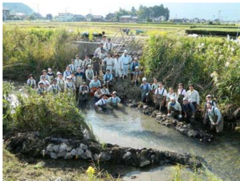
写真-1 桂川の「小さな自然再生」の例（パーブ工）

また、「小さな自然再生」の特長は、“川づくりを通じた人づくり・地域づくり”につながることであり、地元の川への愛着の醸成、自然との対話を通じた地域の課題の学び（環境教育）、地域住民の交流の活発化などの波及効果が期待されることから、英語名はそのような意味を込めた「Collaborative Nature Restoration」と訳している。