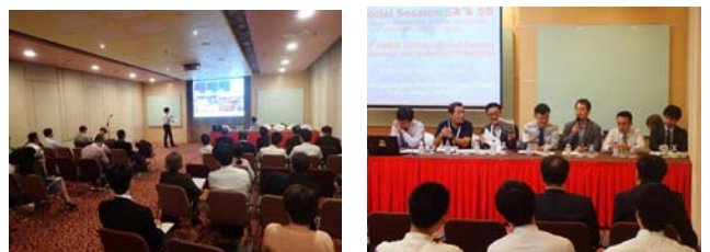
写真-7 ARRN 国際フォーラムの様子