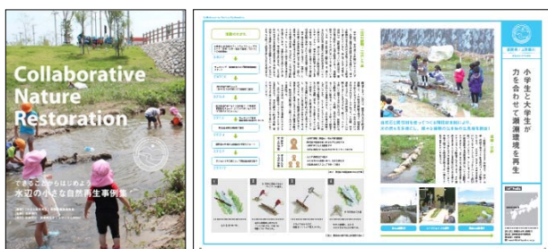
図-2 「小さな自然再生」事例集（2015.3発行）

「小さな自然再生」普及促進プロジェクトは、多様な主体が協働し日曜大工的に自然環境の保全・再生に取組む「小さな自然再生」の技術と英知を高め、当分野に取組む人材の育成を図ること、各地域に相応しい新たな取組みを活性化させることを目的として、公益財団法人河川財団の河川基金の助成事業として、これまで4年間（今年度も継続中）活動が続けてきた（表-2）。