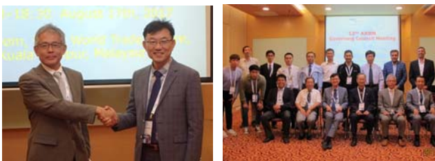
写真-6 ARRN 運営会議の様子