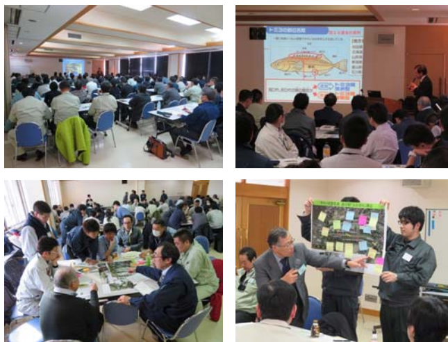
写真－5 秋田県現地研修会の様子

「道の駅と直結した水辺の小さな自然再生と地域の賑わい創出」をテーマとしたワークショップでは、道の駅「なかせん」を交流拠点として、隣接する斉内川の親水性や河川環境の魅力を引き出すための「小さな自然再生」を用いた技術的な議論が行われた。