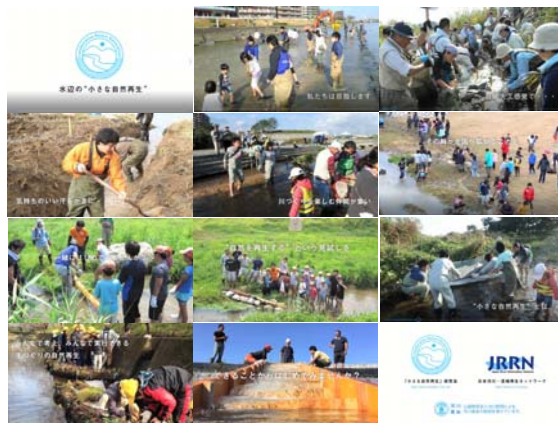
図－3 「小さな自然再生」普及啓発動画

「小さな自然再生」の更なる普及促進を目的に、「小さな自然再生」に取り組んでみたいと考えている人や、施策や資金面で後押しする行政機関や助成団体等の担当者に向けた、小さな自然再生の考え方や具体事例等を紹介する動画(図-3:3分間×2パターン)を制作し、2018年3月に公開した。この動画を教材として活用したいというニーズがあれば、解像度の高いデータの提供も行っており、大学の講義や海外での情報発信などに活用していただいている。