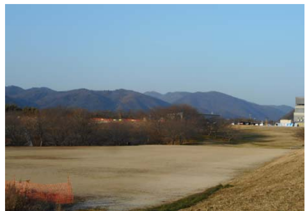
写真－3 一の荒手（百間川）