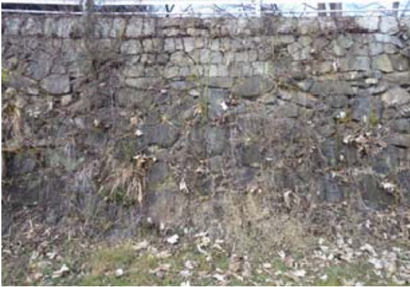
写真－4 石の積み方が途中から変化している石積護岸（相生橋上流の旭川右岸）

(2) 現地踏査により発掘されたその他の地域資源 前項にて示した他に、地域資源としてあげられたものの一部を以下に示す。