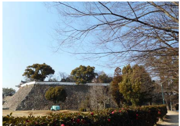
写真－7 南側から望む岡山城