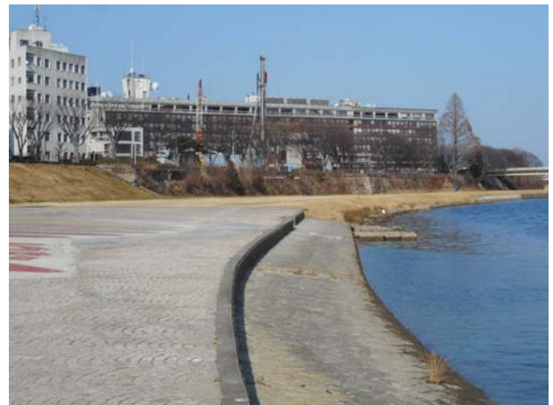
写真－2 京橋の船着場跡（旭川）