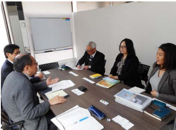
写真－1 タウン情報誌へのヒアリング状況