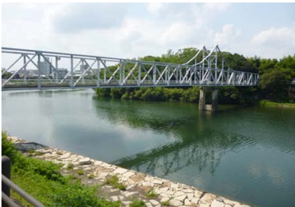
写真－5 旭川右岸側から望む岡山後楽園