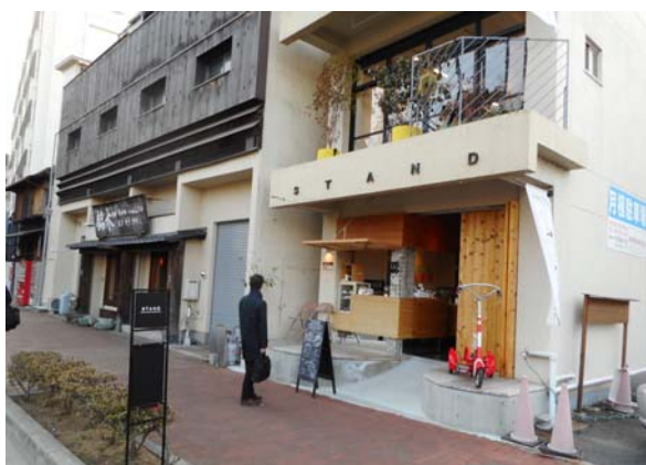
写真－8 石山公園付近の店舗