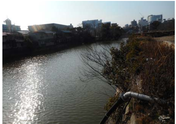
写真－6 岡山城内堀の状況