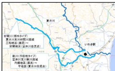
図-1 対象地区の位置図

水量や水質、水辺の風景等、水環境は地域によって様々であるため、人々の水環境に対する意識は居住地に大きく関係すると考えられる。そこで本研究では、対象地区として市街地と郊外の2箇所を選定した。市街地は夏井川支川の新川流域、郊外は夏井川支川的好間川流域を選定した（図-1）。