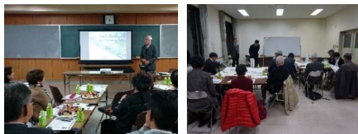
写真-1 ワークショップ等の開催状況 (左：新川流域のイベント、 右：好間川流域の第2回ワークショップ)

またワークショップ中は自グループでの意見交換に集中できるように、他グループのテーブルがなるべく視界に入らないよう机を配置した。