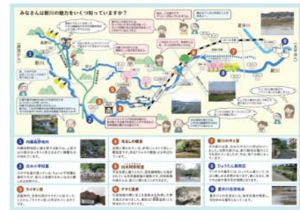
図-2 新川流域マップ

イベントについては、開催期間が冬季となることから、流域の魅力を箇所等を現地の写真を用いて上流から下流に向かって順に紹介しながら、地元有識者より流域の歴史、文化等について講談していただく擬似的な現地見学体験（バーチャルツアー）を行うこととした。