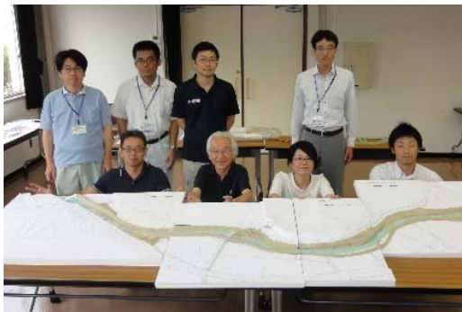
写真-1 立案した河道計画（模型作成）

①講義（多自然川づくりのポイント）、②事例河川の現地調査、③事例河川の保全や改善に関する検討、④河道計画の立案（事例河川を対象に、現地調査や検討内容を踏まえ、模型の作成を含む平面・縦横断計画の見直し）