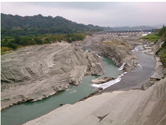
写真-2 異常侵食状況（石岡堰直下流）