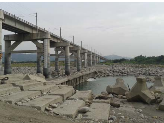
写真-3 鉄道橋の直下流の局所洗掘状況