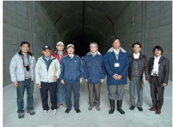
写真-4 美和ダムバイパストンネル呑口