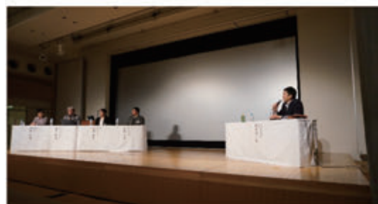
図 研究発表会の開催状況 (上:集中ポスターセッション、下:話題セッション)