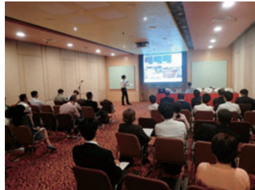
写真 ARRN 国際フォーラムの様子