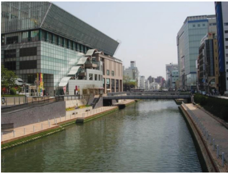
博多川（博多リバレイン付近）

そのため、都心に残された貴重な親水空間であった博多川の蘇生に努めるとともに、これを生かしながら多くの市民が集い、憩う、水と緑のオアシス空間として整備し、うるおいと活力のあるまちづくりをめざす「博多川夢回廊整備構想」を策定し、沿川の再開発事業と並行し、第一期事業として平成3年度から12年度までに環境護岸や川端ぜんざい広場の整備などを実施した。