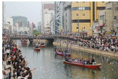
博多川（船乗り込み）

オープンカフェは、河川敷に隣接したホテルの民有地と地先河岸緑地とを一体利用する地先利用型で行っており、平成24年4月に河川管理者による区域指定を受け、天神地区のエリアマネジメント団体が施設占有者となって実施している。