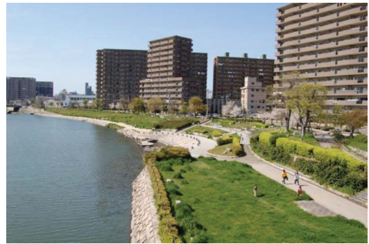
那珂川（リバーフロントプレイス）

河川整備については、河川改修にあわせた良好な水辺空間を形成する「那珂川ふるさとの川整備事業」を進めることとし、沿川の市街地整備と連携して、平成3年度から21年度まで河川改修事業を行い、多目的広場であるリバーフロントプレイス、散策・ジョギングロード等の整備を行った。