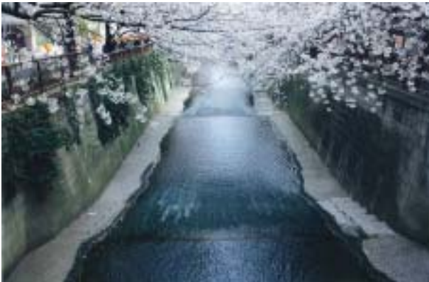
図-3 三面張りの都市河川（東京都、目黒川）

東京などの都市河川に多いコンクリート三面張りの河川は、用地取得が困難なため、河幅を広げることが出来ず仕方なく河床を深くした結果、垂直な河岸の崩壊を防止するため鉄筋コンクリートの護岸が必要になり、次に河床が洗掘されると護岸が危ないというので河床にもコンクリートを張り、結局フタの無いコンクリートの箱のような断面形状の河川となってしまったのである。