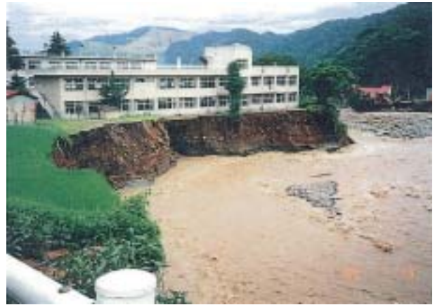
図-4 河岸侵食の恐ろしさ（平成7年、新潟県関川、校舎の手前に在ったプールはあとかたも無く流された）

自然のまま放置しておく、河川は蛇行したり方向を変えたり一ヶ所に停まっていることが無い。河川が自由に動きまわると、人間側の土地利用、道路計画、橋梁など全てがメチャクチャになるので、河川改修の第一歩は河川を固定することである。そのために、河岸の浸食崩壊を防止する護岸を洪水の水