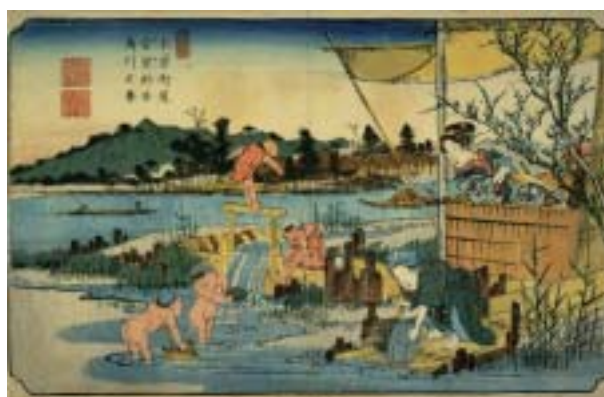
図-6 川と親しむ暮らし （英泉、広重：木曾街道六十九次、倉賀野宿烏川之図）

子供たちが元気に水遊びに興じ、母親は心配して小言を云い、下女は釜を流水で洗っている。遠くには米俵を運ぶ舟と筏が見える。川と人との係わりをよく伝えてくれる絵である。