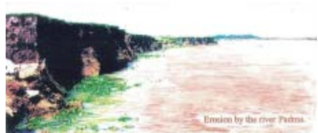
図-5 バングラデシュの大規模な河岸侵食

河岸が軟弱な土質であるのに護岸などの防止工が殆ど施されていないバングラデシュの河川では、洪水のたびに河岸侵食が進み多くの農地や集落が流失する。このため河岸の侵食防止は国土保全上の重要なテーマとなっているのである。