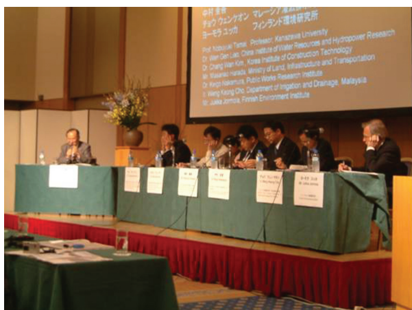
フォーラム開催風景

(URL: http://www.a-rr.net/japan/events/eventhtml/4_i_forum.html )