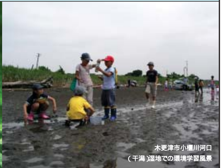
木更津市小櫃川河口 (干潟)湿地での環境学習風景