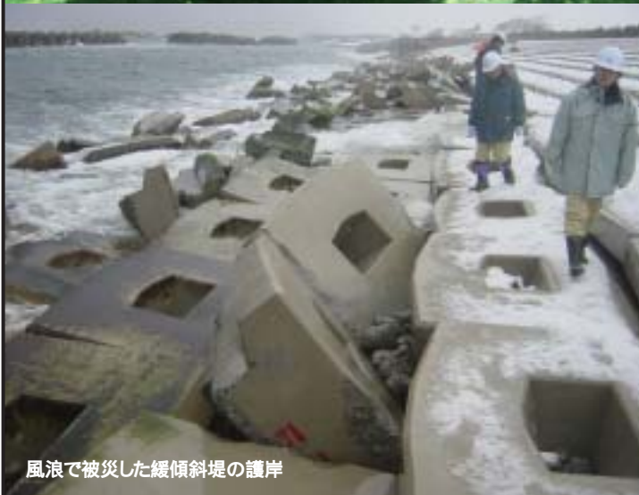
風浪で被災した緩傾斜堤の護岸