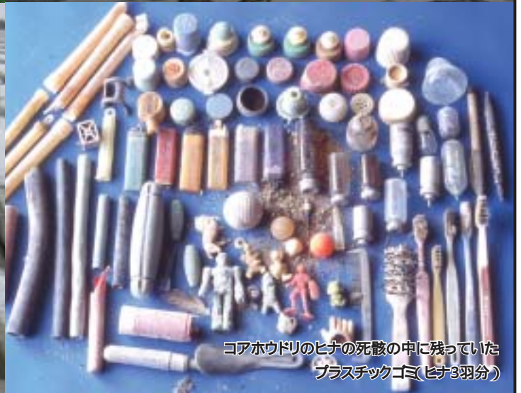
コアホウドリのヒナの死骸の中に残っていた プラスチックゴミ(ヒナ3羽分)