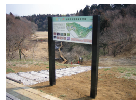
利根川水系高崎川（千葉県佐倉市）