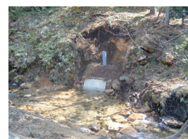
江の川水系大口川（広島県北広島町）