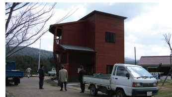
高津川水系高津川（島根県日原町）