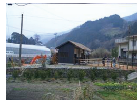
上灘川水系上灘川（愛媛県双海町）