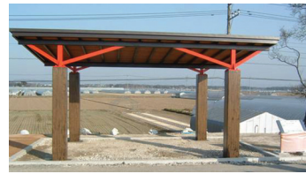
利根川水系鬼怒川（栃木県二宮町）

なお、平成17年度は水辺施設を7施設設置し、出版物を7種類程度作成する予定である。