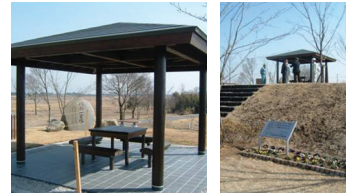
利根川水系鬼怒川（栃木県小山市）