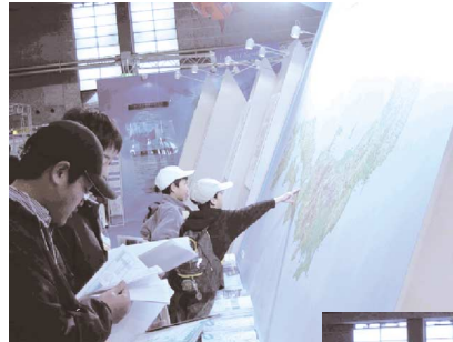
日本の川展示ブース