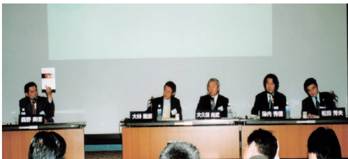
3月19日のパネル討論

「水のEXPO」では約500の企業・団体が出展参加したほか、水をテーマにしたシンポジウムが連日開かれ、講演やパネル討論会が行われた。リバーフロント整備センターにおいても国土交通省河川関連財団協同展示にて「日本の川、世界の川」のタイトルで日本の川の風景や世界の大流域の姿を写真で紹介した（FRONT掲載写真多数）。