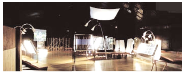
写真-4 展示会場内 (第1ステージから第3ステージ方向)