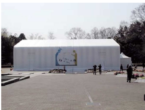
写真-3 展示会場の外観