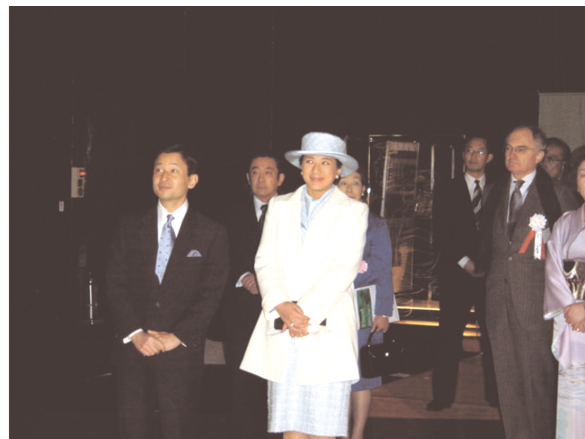
写真-2 展示会場内をご視察される皇太子殿下・同妃殿下

なお、一般公開に先立ち、3月16日には、皇太子殿下・同妃殿下の御臨席のもと開会式典が挙行された。