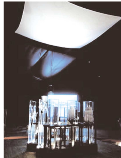
写真-5 第3ステージ「ブルーダイヤモンド」