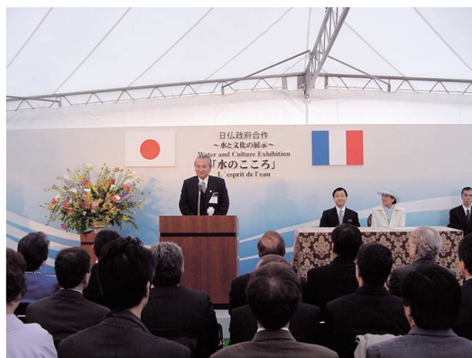
写真-1 挨拶をする中馬国土交通副大臣と皇太子・同妃両殿下