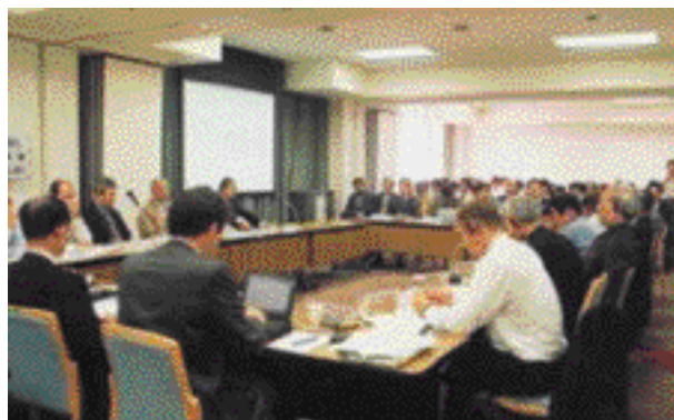
ラウンドテーブルディスカッション

今後は、このシンポジウムの成果を「川の自然再生に関するガイドライン」(案)としてまとめ、「第3回世界水フォーラム」で提案していくものである。