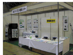
上：当センター出展ブース