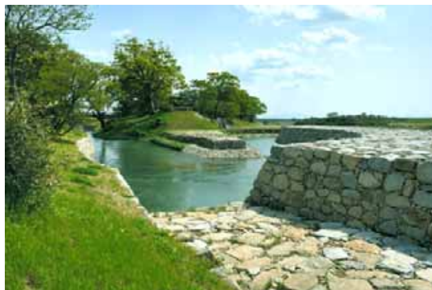
* 復元整備された石井樋(左:航空写真 右:天狗の鼻と象の鼻/野越)