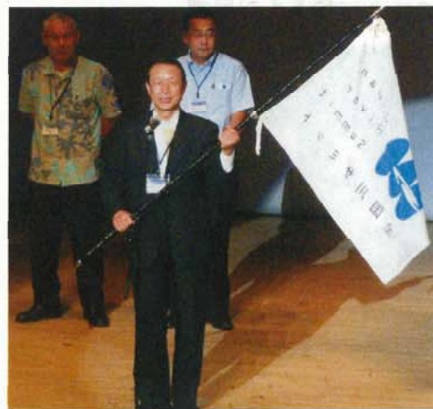
右上：サミット旗の受け渡し 揖斐川町から荒川下流域沿川自治体 代表へ