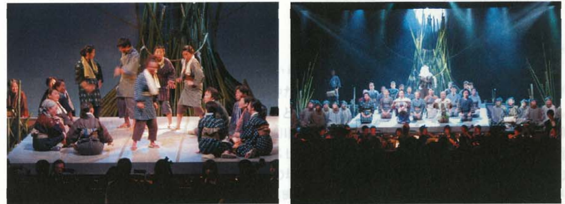
(創作オペレッタ「水神」の様子)

初日(28日)には、全国川サミット参加市区町村の方々も視察を行い、町民による熱いメッセージを全国に向けて発信することができた。