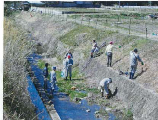
(町職員による河川清掃)