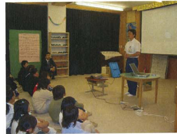
(5月25日 坂内小中学校)