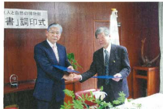
(兵庫県立人と自然の博物館との協力協定)

運動を推進することで、活動が地域に浸透していく、また職員の意識も高まるといった考え方から、毎年行っています。今ではこのボランティア活動が地域と一体となり、さまざまな地区でも行われるようになりました。写真(上段右)は、阿小谷小学校と協力して清掃を行ったときの模様です。