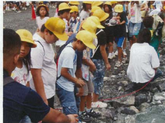
(小学生によるロック材盛立)