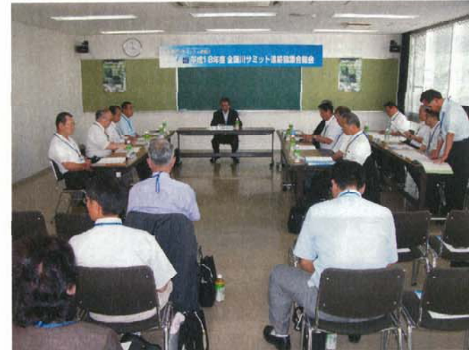
(全国川サミット連絡協議会総会)