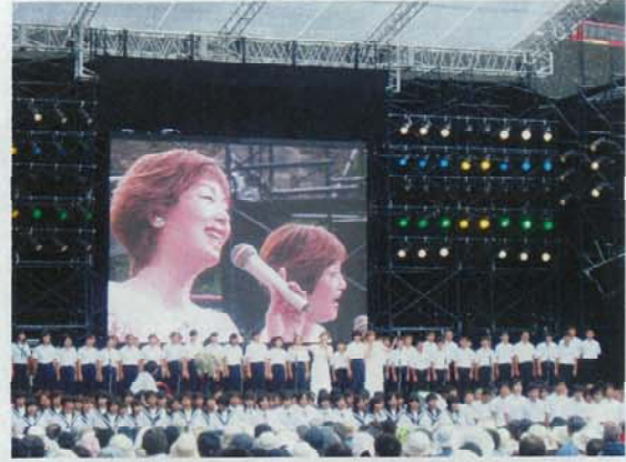
(中学生による大合唱)