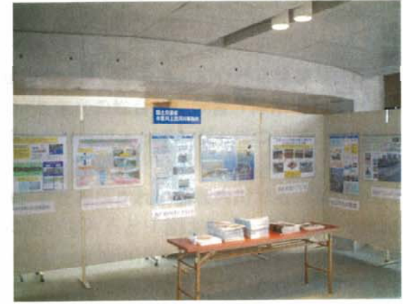
(出展ブースの様子、木曾川上流工事事務所)