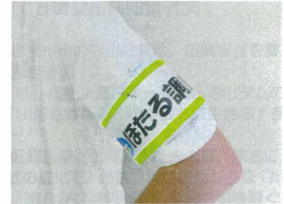
（ホタル調査員：腕章）

調査結果については現在集計中ございまして、本日、この場で報告することはできませんが、集計結果については町のホームページでお知らせする予定でございますので、是非ともご覧頂ければと思います。