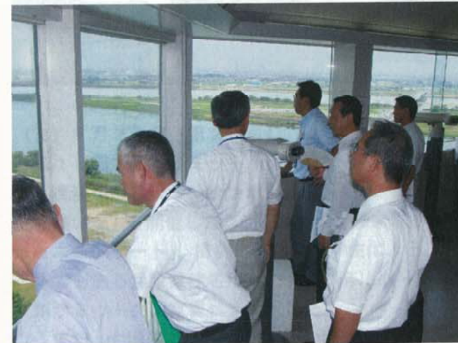
（木曾三川公園センターでの視察風景）

翌日に開催される「徳山ダムふるさと湖底コンサート」を含め、揖斐川の最上流域から最下流域に至るまでの状況を参加していただいた自治体関係者に視察していただき、揖斐川流域の人々がどのようにして川の恵みを楽しみ、また川を治めてきたかを理解していただくための趣旨であった。