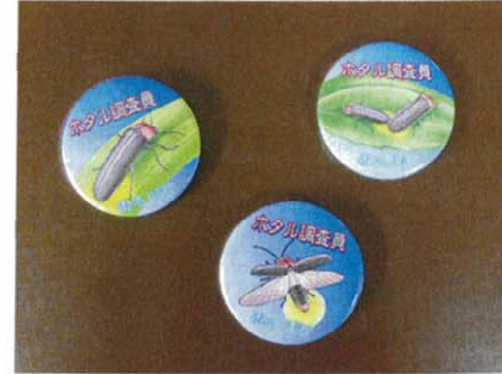
（ホタル調査員：缶バッジ）

調査員には、子どもの参加も呼びかけていたこともありまして、登録して頂いた方全員に缶バッジ（下段左）を配布し、調査員として参加される記念品としました。また、夜間に調査を行うということもございまして、他のホタル鑑賞者と区分するためにも腕章（下段右）を作成し、安全面にも配慮いたしますと同時に、調査員としての気持ちを持って取り組んで頂けるようにいたしました。