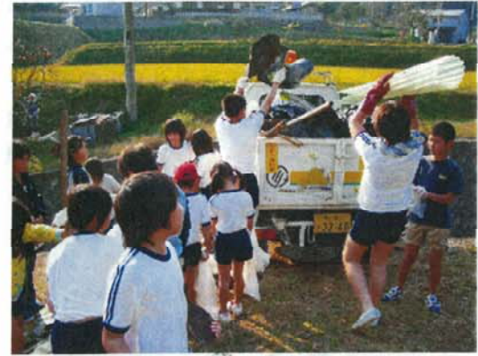
(小学校と一体となった清掃活動)

運動を推進することで、活動が地域に浸透していく、また職員の意識も高まるといった考え方から、毎年行っています。今ではこのボランティア活動が地域と一体となり、さまざまな地区でも行われるようになりました。写真(上段右)は、阿小谷小学校と協力して清掃を行ったときの模様です。